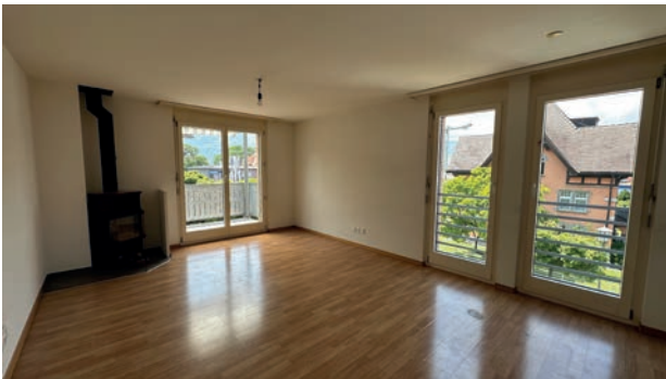
Wohnzimmer | Essen