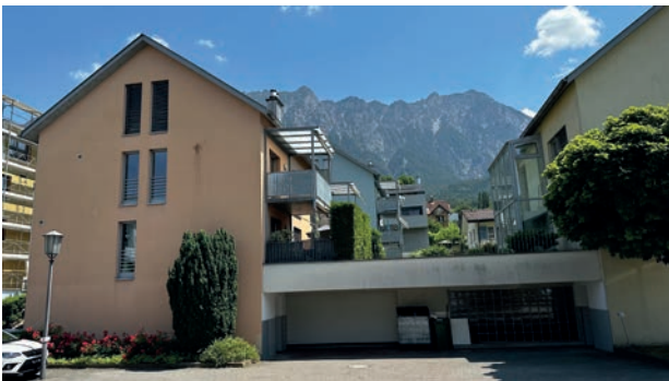
Haus (links) mit Tiefgarage