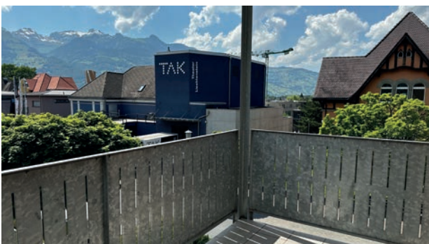
Ausblick vom Balkon