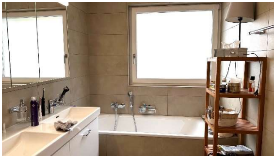
Badezimmer / Bad