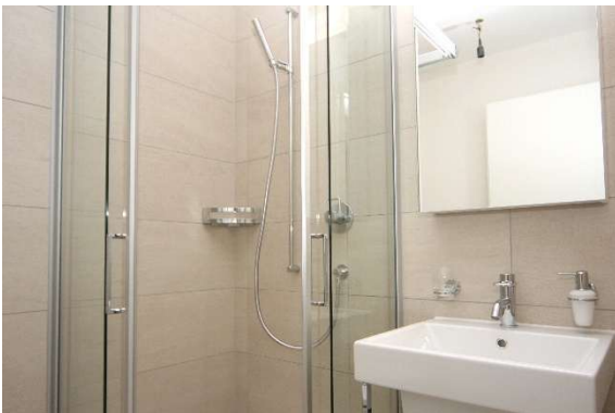
Dusche / WC