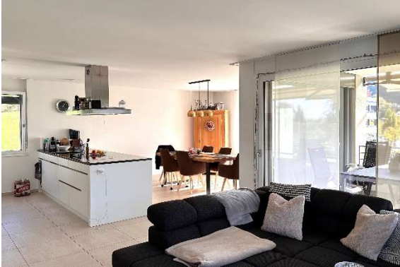
Bad, Dusche, WC