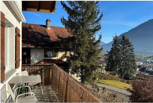
Sitzplatz gegen Süden